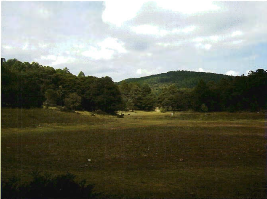
Figura 9. Bosque de pino-encino en Miquihuana.