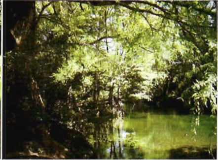
Figura 14. Sabinos en Gómez Farías.