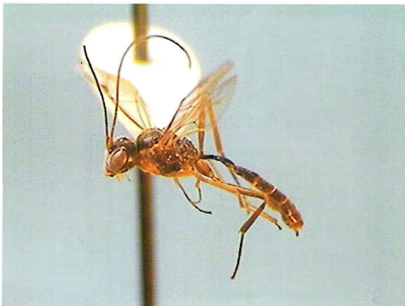
Figura 21. Atopotrophos bucephalus .