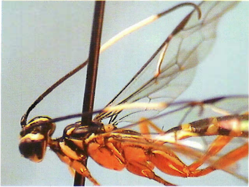
Figura 25. Ganodes matai .