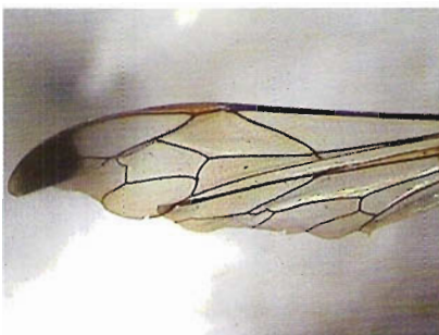
Figura 18. Ala de Labena eremica .