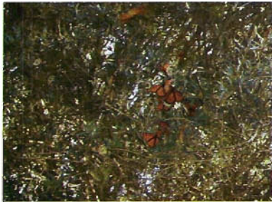
Figura 11. Mariposa monarca en olivos de Tula