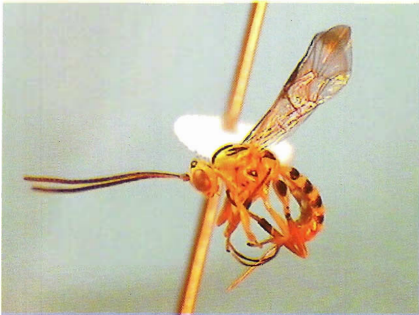
Figura 26. Lycorina apicalis .