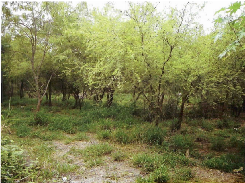
Figura 3. Pastos en huizachal de Victoria.