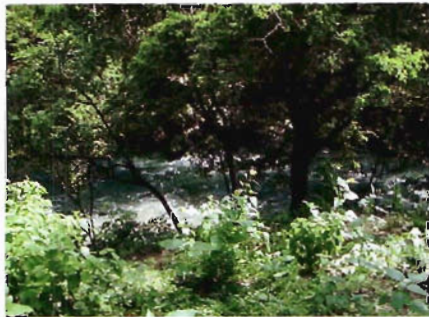
Figura 5. Balneario Los Nogales, Jaumave.