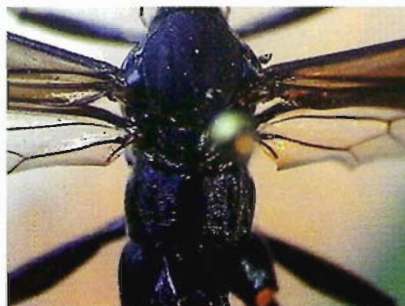
Figura 20. Tórax de Pimpla caeruleata .