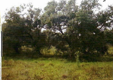
Figura 16. Encinal en Altamira.