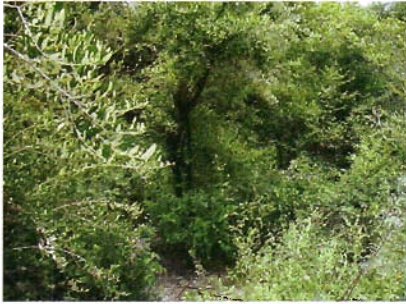
Figura 7. El Salto, Palmillas.