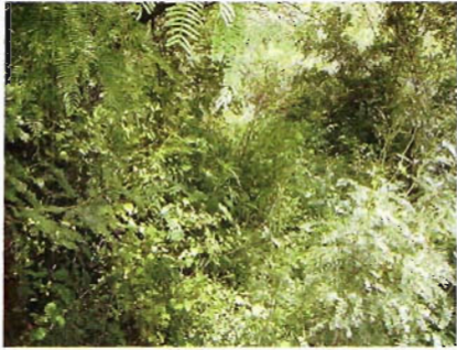
Figura 1. Mezquite en Méndez.