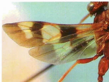
Figura 16. Ala de Compsocryptus texensis .