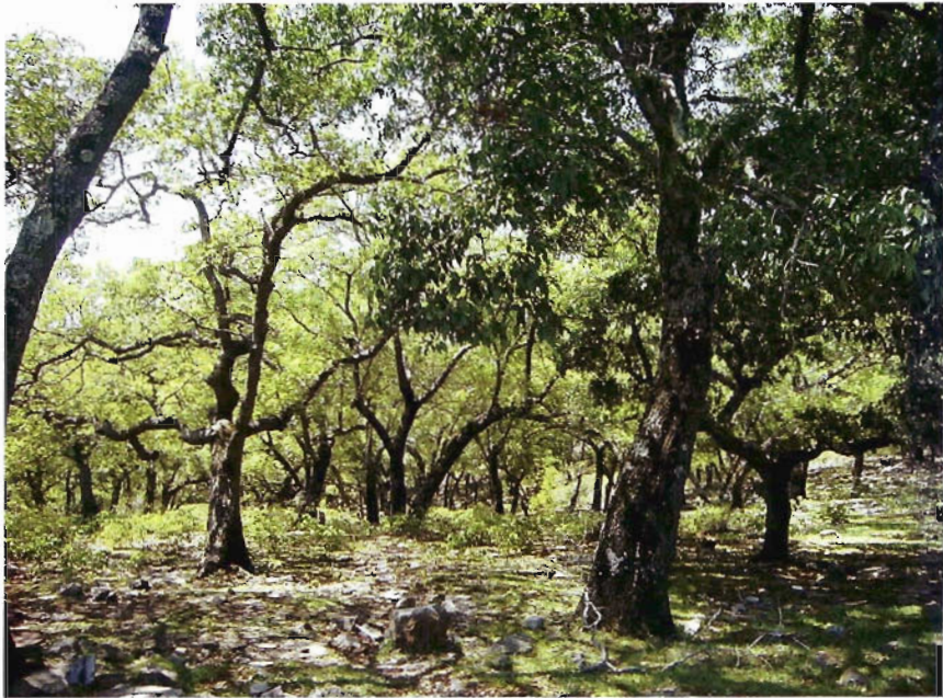
Figura 4. Bosque de encinos en El Madroño, Victoria.