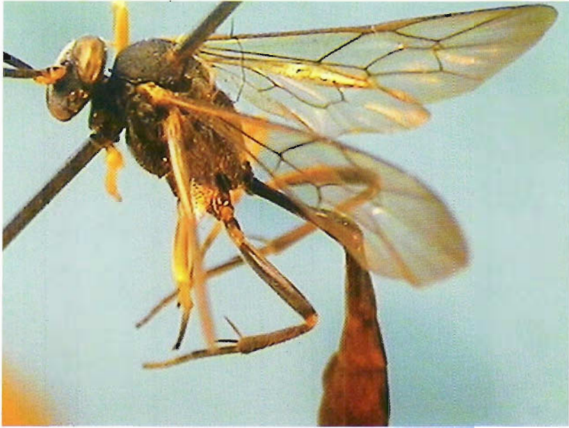
Figura 23. Casinaria sp.