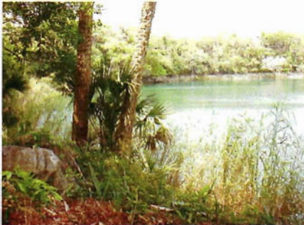
Figura 15. Cenotes en Aldama.