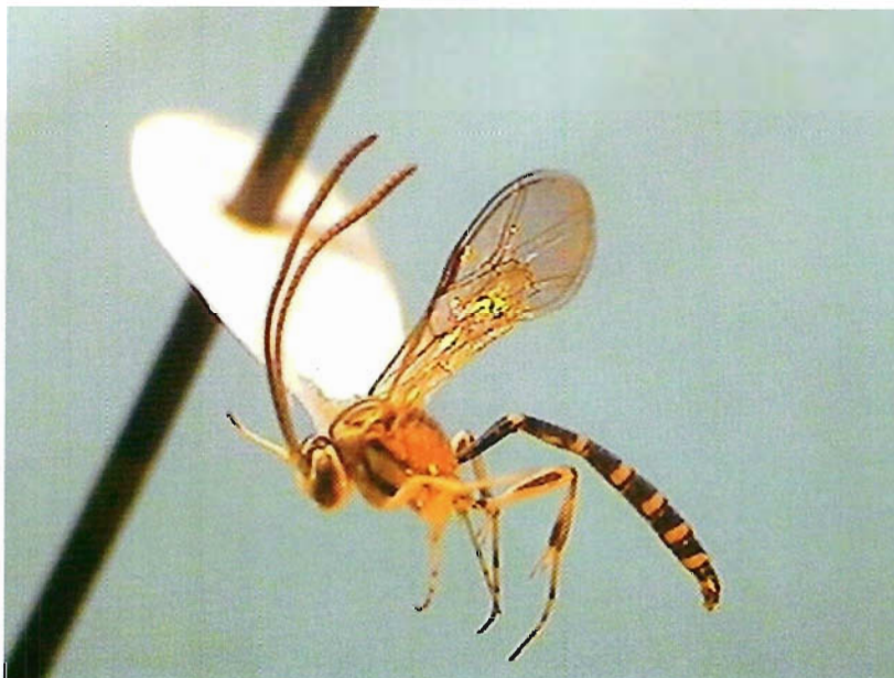
Figura 22. Brachycyrtus pretiosus .