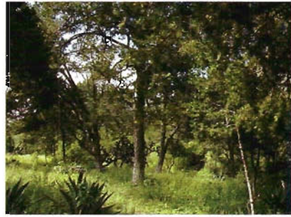
Figura 8. Bosque de pino piñonero en Miquihuana.