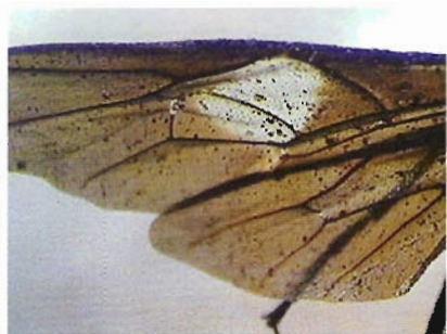
Figura 19. Ala de Thyreodon rivinae .