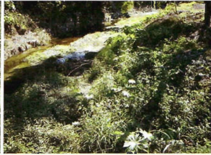
Figura 2. Vegetación riparia en Victoria.