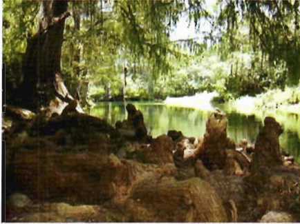
Figura 13. Raíz de sabino en Llera.