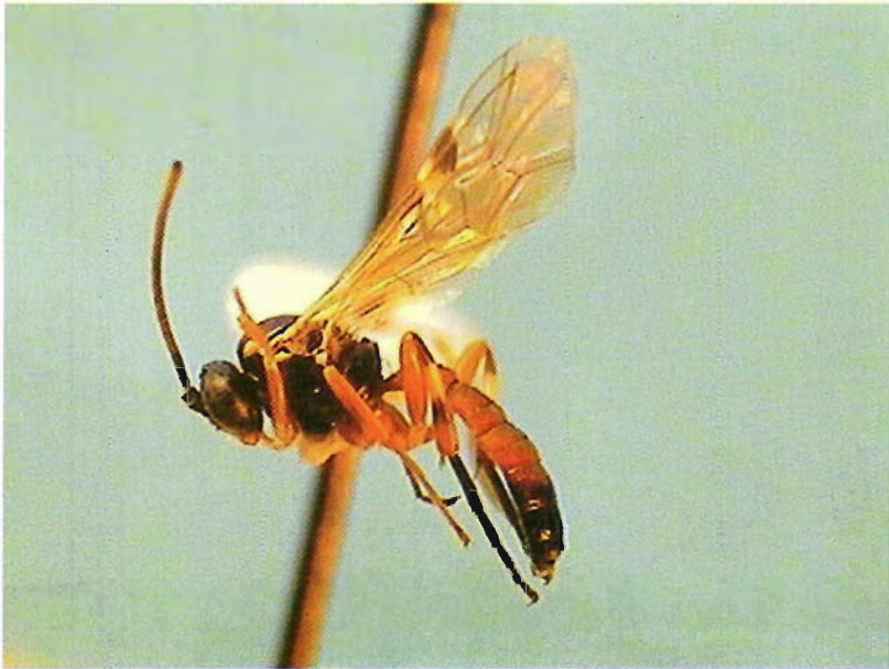
Figura 24. Diplazon laetatorius .