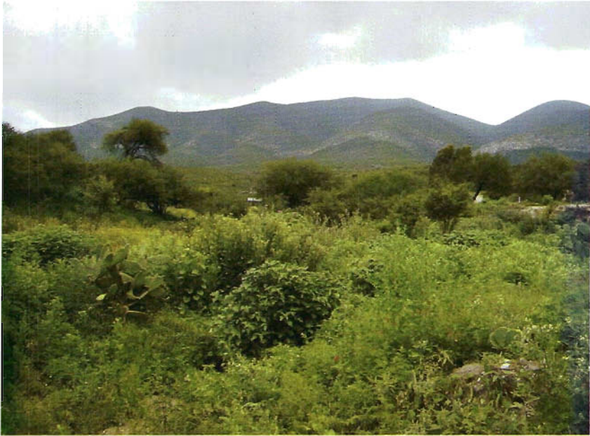
Figura 10. Matorral en Bustamante.