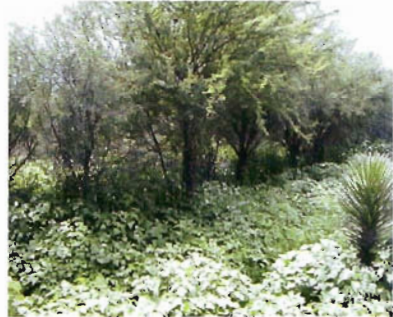
Figura 6. Huizachal en Palmillas.