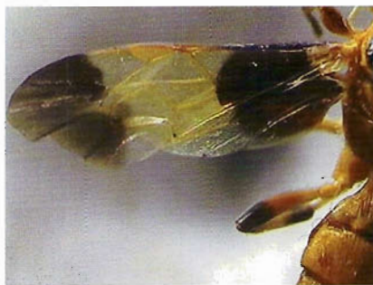
Figura 17. Ala de Joppa decorata .