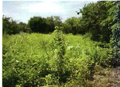
Figura 12. Cítricos en Llera.